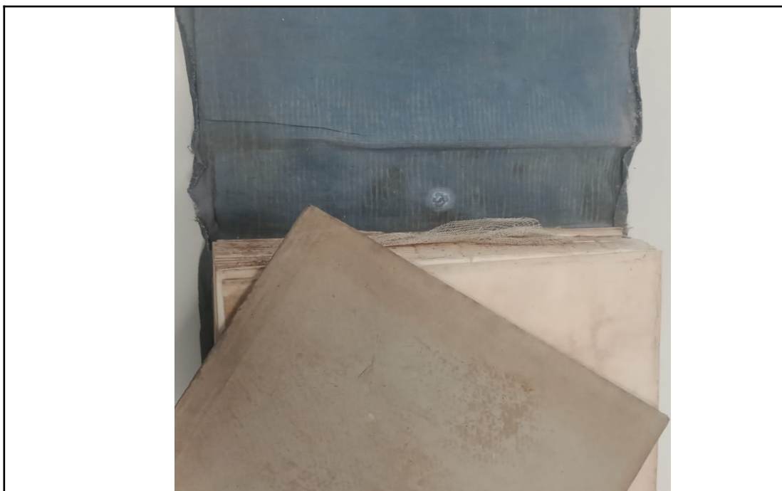
Imagem 6 - Exemplar em condição inadequada

francês e espanhol, e a distribuição de anos de lançamento destas obras, com esses abrangendo desde as décadas de 1930 à 1990. Além disso, verificamos que os temas mais encontrados no acervo são Direito do Trabalho, Direito Civil, Direito Constitucional e Direito em geral. Devido à idade dos livros alguns desafios foram encontrados no decorrer das atividades, como a ausência de ficha catalográfica, e demais informações editoriais nas obras, o que dificultou o processo de catalogação e indexação. A condição física de alguns dos livros, também dificultou o processamento técnico das obras, o que demandou a utilização de máscaras e luvas cirúrgicas descartáveis, para o manuseio dos livros do ACP, que dentre estes também tinha exemplares em condições inadequadas para manuseio, que descarte em razão do em que se encontravam. Como podemos observar na imagem 6 abaixo.