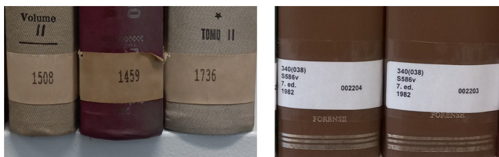
Imagem 3 – Etiquetas de localização anteriores e atuais

Assim, os números de chamada dos livros, registrados no SIABI e nas etiquetas, foram ajustados. A partir da imagem a seguir é possível observar a diferença entre as etiquetas de localização anteriormente utilizadas para o Acervo Chagas Pereira e as utilizadas atualmente: